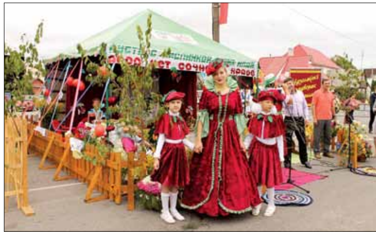
На “Вішнёвым фестывалі” была і Вішнёвая каралева

Як бачым, “Вішнёвы фестываль” — яскравы прыклад таго, як раённы горад, выкарыстоўваючы свой прыродны рэсурс, можа стварыць культурную падзею міжнароднага ўзроўню. Гэта цікава і мясцоваму