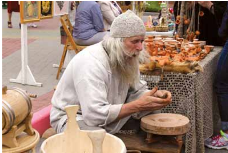
Экзатычны ганчар на “Вішнёвым фестывалі”

Беларусі — Год культуры. Таму і дзейнасць ЦБК як унікальнай установы ў Прыбалтыцы, што пашырае беларускую культуру, сёлета скіраваная на ўмацаванне сувязяў з установамі культуры Беларусі, на ўдзел у розных беларускіх фестывалах і святах, абмен досведам працы.