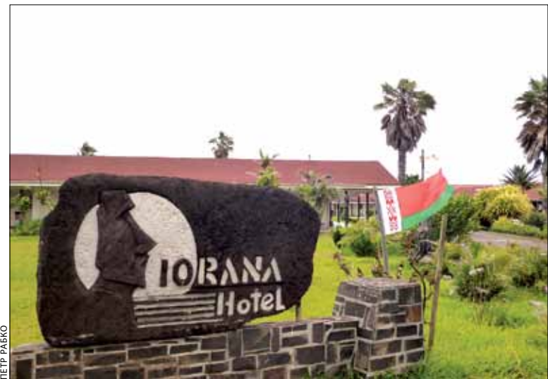
Ля гатэля на востраве Пасхі — беларускі сцяг

Мы — на сушы жывём, аднак мора ўсё ж прыцягвае да сябе. І адно з нашых апошніх плаванняў, ужо ў якасці пасажыраў, мы здзейснілі летась, у канцы лістапада. Пабывалі на чылійскім востраве Рапа-Нуі (яго яшчэ называюць востраў Пасхі). Натхніла нас на такую вандроўку міжнародная экспедыцыя на плятах “Кон-Цікі 2” — пра яе можна пачытаць у інтэрнэце. Дарэчы, на востраве Пасхі быў мой 342-й марскі порт. Не прэтэндуючы на Кнігу рэкордаў Гінеса, скажу: я — адзіны капітан з