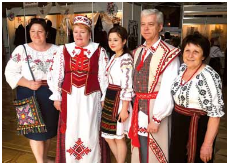
З беларусамі многія хацелі сфатаграфавання

Каб чытаць узоры, сімвалы на беларускіх строях — трэба іх вывучаць, звяртацца да спецыяльнай