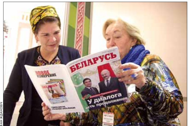
Беларуска-туркменскі дыялог у Ашхабадзе

Газета "Эдэбіят ве сунгат" праяўляе цікавасць да Беларусі, яе культуры, літаратуры. У розныя гады яна расказвала на сваіх старонках пра Янку Купалу, Барыса Мікуліча, Якуба Коласа, Аркадзя Марціновіча ды іншых мастакоў слова з Беларусі. Відавочна, ужо даўно наспела патрэба прысвяціць беларускай літаратуры адмысловы, спецыяльны выпуск выдання. Бо сяброўства беларускага і туркменскага народаў умацоўваецца, а сумесных літаратурных, культурных праектаў, сустрэч — усё больш. У прыватнасці, летась у снежні, калі быў афіцыйны візіт Прэзідэнта Беларусі Аляксандра Лукашэнка ў Туркменістан