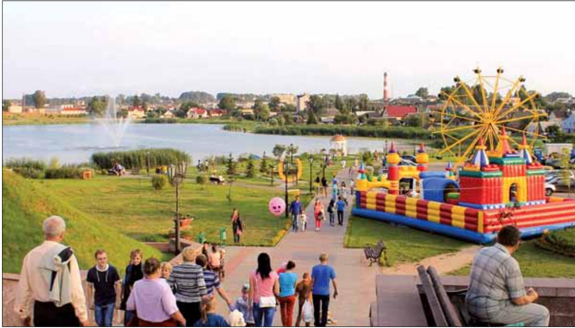
Прагуляцца па святочным горадзе — адно задавальненне

Наша “Купалінка” з яркай праграмай паўдзельнічала ў заключных імпрэзах, якіх было шмат. Гэта і незабыўнае святочнае шэсце “У гасцях у вішні” на чале з Вішнёвай каралевай, адкрыццё скульптуры “Сям’я” на Цэнтральнай плошчы (з удзелам Міністра культуры Барыса Святлова), канцэрт жывой музыкі, урачыстая рэгістрацыя “Вішнёвага вясяля”, канцэрт замежных гасцей “Вянокдружбы”... Ладзіліся яшчэ выстава жывапісу, выстава-дэгустацыя кулінарных вырабаў, прэзентацыя калекцыі льянога адзення, майстар-класы, працавалі вулічны ган-