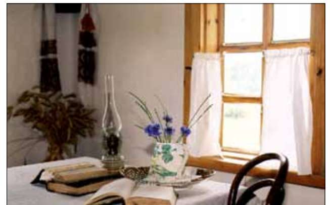
Ракуцёўшчына памятае Максіма Багдановіча

ла родная мова, якой паэт імкнуўся дасканала авалодаць. Натхнялі яго і водары лугоў, бруенне крыніц, шапаценне лясоў, птушыныя спевы... Усё тое, заўважым, ёсць у Ракуцёўшчыне і сёння, а ў 1911-м, ды і пазней вершамі, вобразамі, рыфмамі адгукалася ў душы паэта. І лёгка ліліся з чуйнага сэрца, перапоўненага вечнай паэзіяй жыцця, вершы. А неўзабаве тоўсценькі сшытак, спярэшчаны раўнюткам почыркам, стаўся асновай зборніка вершаў Максіма Багдановіча “Вянок”. Менавіта побыт у Ракуцёўшчыне і па-