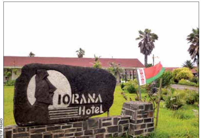
Ля гатэля на востраве Пасхі — беларускі сцяг

Мы — на сушы жывём, аднак мора ўсё ж прыцягвае да сябе. І адно з нашых апошніх плаванняў, ужо ў якасці пасажыраў, мы здзейснілі летась, у канцы лістапада. Пабывалі на чылійскім востраве Рапа-Нуі (яго яшчэ называюць востраў Пасхі). Натхніла нас на такую вандроўку міжнародная экспедыцыя на плятах “Кон-Цікі 2” — пра яе можна пачытаць у інтэрнэце. Дарэчы, на востраве Пасхі быў мой 342-й марскі порт. Не прэтэндуючы на Кнігу рэкордаў Гінеса, скажу: я — адзіны капітан з