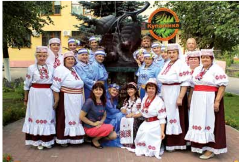
Гурт “Купалінка” з Даўгаўпілса гасцюе ў Глыбокім

І вось ужо чацвёрты фестываль з 18 па 23 ліпеня праходзіў у Глыбокім, прычым наведаў яго і Міністр культуры Барыс Святлоў. Па запрашэнні Глыбоцкага райвыканкама ў свяце паўдзельнічаў ансамбль народнай песні “Купалінка” з Даўгаўпілса, з Цэнтра беларускай культуры. А паколькі сам фестываль стаў магчымым дзякуючы працавітым мясцовым “вішняводам”, то і мы ехалі да іх не толькі спяваць ды танчыць. Маём намер адладжваць з горадам дзелавыя сувязі. Таму і было падпісана паміж установамі Даўгаўпілса і Глыбокага пагадненне аб супрацоўніцтве ў сферы культуры. Як вядома, 2016-ы ў