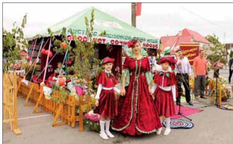
На “Вішнёвым фестывалі” была і Вішнёвая каралева

Як бачым, “Вішнёвы фестываль” — яскравы прыклад таго, як раённы горад, выкарыстоўваючы свой прыродны рэсурс, можа стварыць культурную падзею міжнароднага ўзроўню. Гэта цікава і мясцоваму