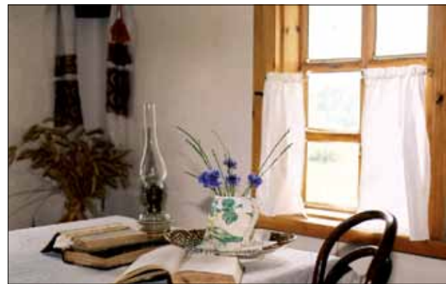
Ракуцёўшчына памятае Максіма Багдановіча

ла родная мова, якой паэт імкнуўся дасканала авалодаць. Натхнялі яго і водары лугоў, бруенне крыніц, шапаценне лясоў, птушыныя спевы... Усё тое, заўважым, ёсць у Ракуцёўшчыне і сёння, а ў 1911-м, ды і пазней вершамі, вобразамі, рыфмамі адгукалася ў душы паэта. І лёгка ліліся з чуйнага сэрца, перапоўненага вечнай паэзіяй жыцця, вершы. А неўзабаве тоўсценькі сшытак, спярэшчаны раўнюткам почыркам, стаўся асновай зборніка вершаў Максіма Багдановіча “Вянок”. Менавіта побыт у Ракуцёўшчыне і па-