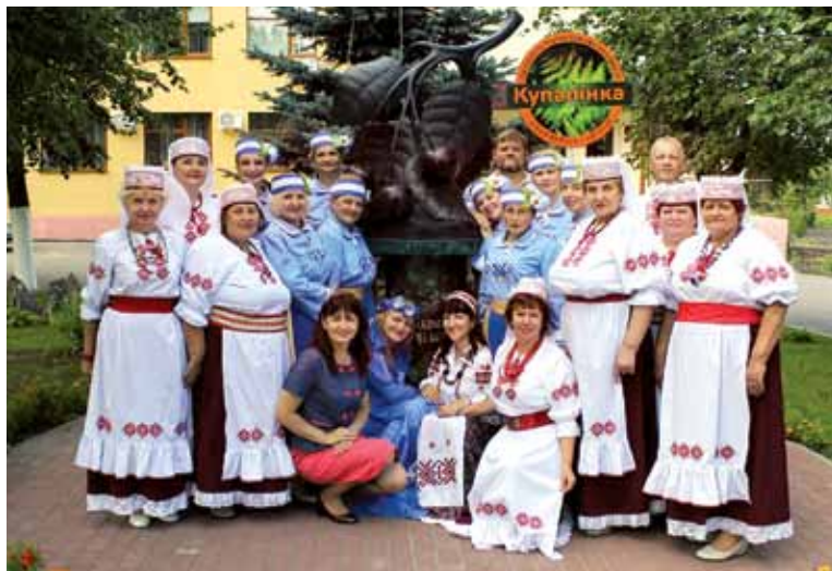
Гурт “Купалінка” з Даўгаўпілса гасцюе ў Глыбокім

І вось ужо чацвёрты фестываль з 18 па 23 ліпеня праходзіў у Глыбокім, прычым наведаў яго і Міністр культуры Барыс Святлоў. Па запрашэнні Глыбоцкага райвыканкама ў свяце паўдзельнічаў ансамбль народнай песні “Купалінка” з Даўгаўпілса, з Цэнтра беларускай культуры. А паколькі сам фестываль стаў магчымым дзякуючы працавітым мясцовым “вішняводам”, то і мы ехалі да іх не толькі спяваць ды танчыць. Маём намер адладжваць з горадам дзелавыя сувязі. Таму і было падпісана паміж установамі Даўгаўпілса і Глыбокага пагадненне аб супрацоўніцтве ў сферы культуры. Як вядома, 2016-ы ў