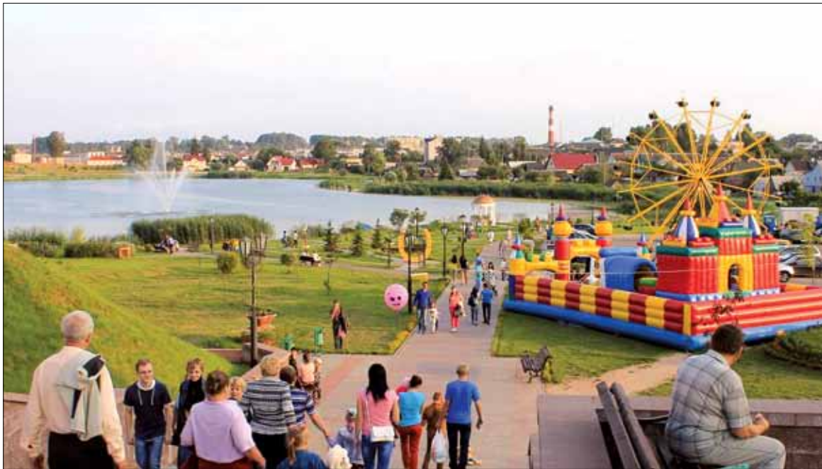
Прагуляцца па святочным горадзе — адно задавальненне

Наша “Купалінка” з яркай праграмай паўдзельнічала ў заключных імпрэзах, якіх было шмат. Гэта і незабыўнае святочнае шэсце “У гасцях у вішні” на чале з Вішнёвай каралевай, адкрыццё скульптуры “Сям’я” на Цэнтральнай плошчы (з удзелам Міністра культуры Барыса Святлова), канцэрт жывой музыкі, урачыстая рэгістрацыя “Вішнёвага вясяля”, канцэрт замежных гасцей “Вянокдзружбы”... Ладзіліся яшчэ выстава жывапісу, выстава-дэгустацыя кулінарных вырабаў, прэзентацыя калекцыі льянога адзення, майстар-класы, працавалі вулічны ган-