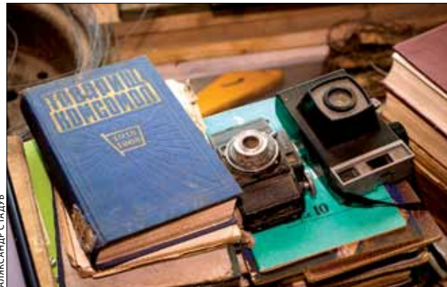
Што ні рэч, то экспанат