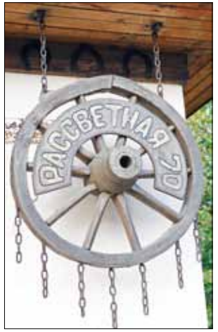
Адрас музея ў Хадакова