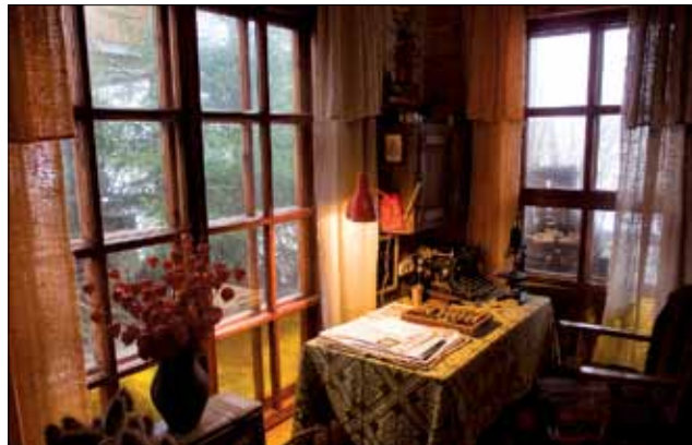
У гасцявым доме на лецішчы