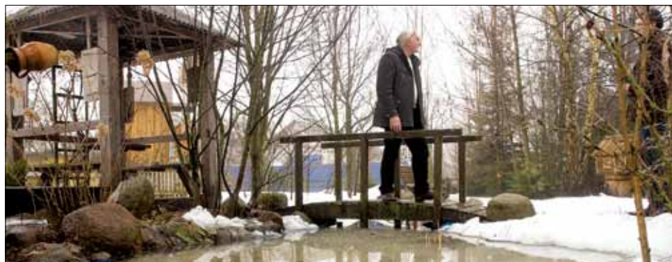
У гэтым этнамузеі ўсё зроблена рукамі гаспадара

неяк малолі, — радуецца майстар. — Аладкі надта ж смачныя атрымаліся!”