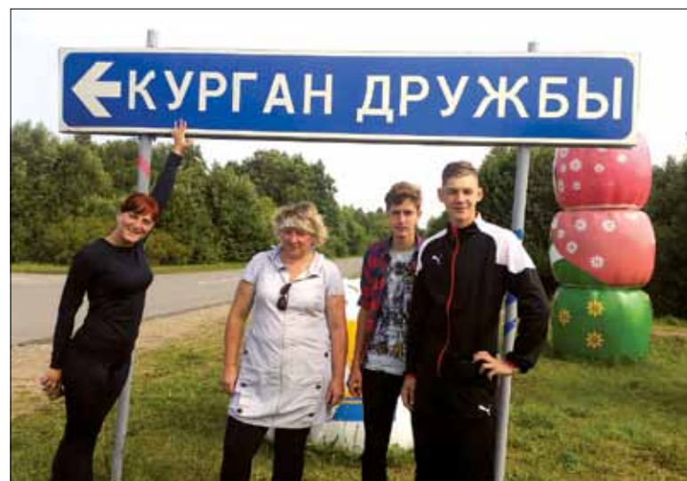
Беларусы з Даўгаўпілса былі ў маладзёжным лагеры ўпершыню

У трэці, суботні дзень — мітынг памяці герояў Вялікай Айчыннай, наведванне Музея баявой славы: гэта даўняя традыцыя лагера. Увесь лагер стаў раніцай на своеасабліваю