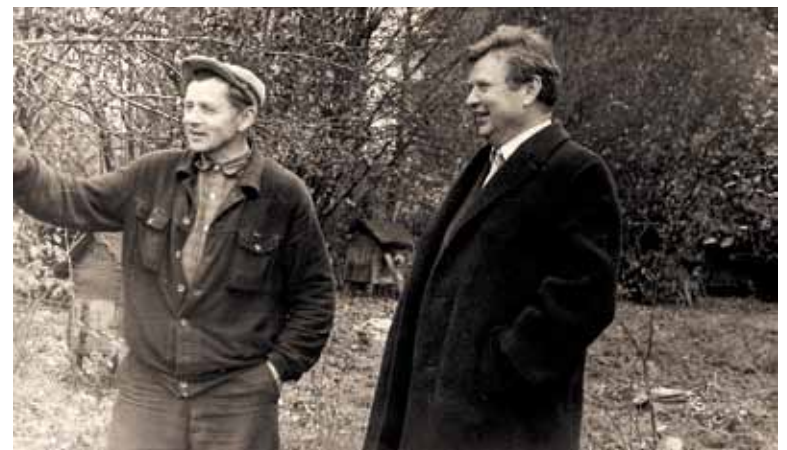
Максім Танк на радзіме з родным братам, Фёдарам Іванавічам

мае і ўдлівыя калегі. Зрэшты, самакрытычнасць была ўласціва яму заўсёды. Вось як, скажам, ацэньвае паэта сваю заходнебеларускую творчасць у дзённікавых нататках “Лісткі календара”. “З жахам аглядзеўся, што мне мінула 27 год! — запісаў ён 29 верасня 1939 года. — А ў мяне толькі некалькі зборнікаў вершаў, сярод якіх 75 працэнтаў слабых, 20 працэнтаў — сярэдніх і толькі 5 працэнтаў — до-