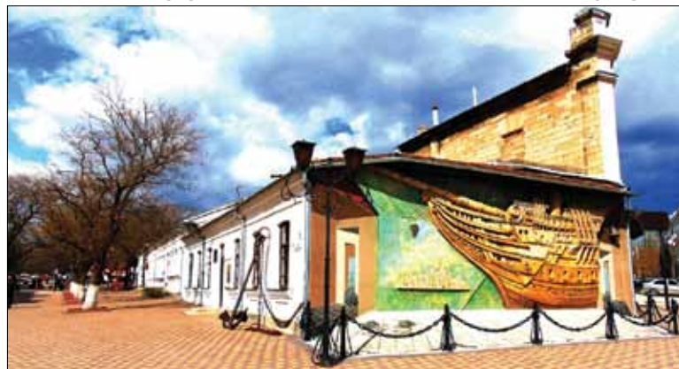
Феадасійскі літаратурна-мемарыяльны музей А. С. Грына

ў Грына трохі больш падоўжаны авал твару”. І ўсё ж папрасіла даць увесць ранейшы здымак з надпісам “Максім Багдановіч (партрэт) у гасцях у Аляксандра Грына (бюст)”.