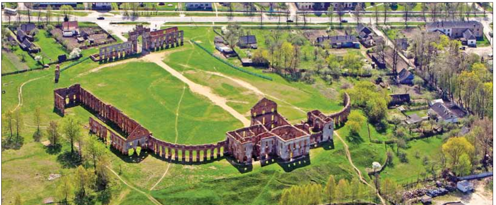
Палацава-паркавы комплекс Сапегаў у гарадскім пасёлку Ружаны прыгожа глядзіцца з вышыні птушынага палёту

Летам у Ружанах можна пачуць розныя мовы: мясцовы палац прафесійным будаўнікам дапамагаюць рэканструюваць валанцёры міжнароднага маладзёжнага аграда “Спадчына Сапегаў”. У ім працуюць маладыя людзі з Беларусі, Нідэрландаў, Чэхіі, Славакіі ды Расіі. Для тых, хто захоча паўдзельнічаць у праекце, на будучыню падкажам: аград арганізуецца пры падтрымцы рэспубліканскай грамадскай арганізацыі “Беларуская асацыяцыя