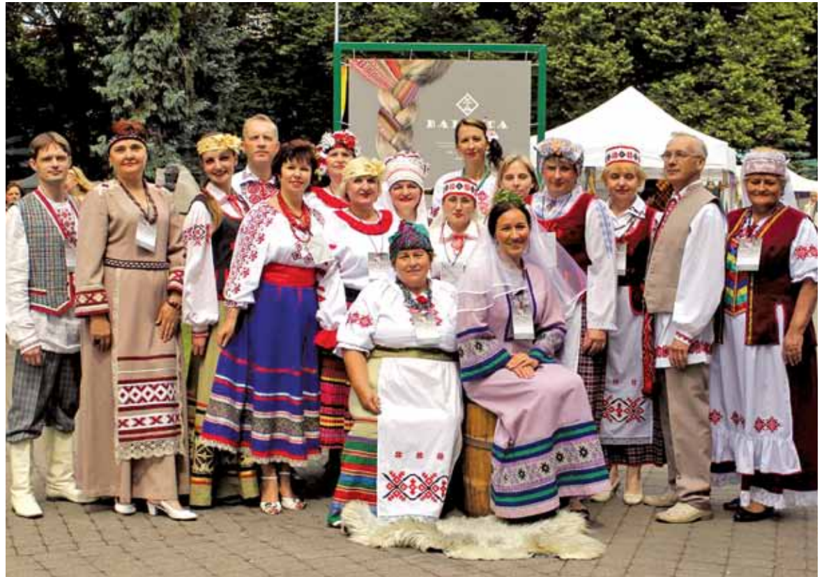
Творчая каманда беларусаў з Даўгаўпілса на міжнародным фестывалі “Baltica” ў Рызе

Наша “Купалінка” — вакальны ансамбль даўгаўпілскага Цэнтра беларускай культуры — знаёміла глядачоў з беларускім народным абрадам “Суборная субота”. Ён праходзіць, паводле звычаяў продкаў, напярэдадні вяселля ў хаце нявесты. Выступ артыстыкі распачалі словамі: “Беларусам уласцівыя працавітасць, дабрыва. А яшчэ — гасціннасць, якую мы сёння і пакажам праз элемент