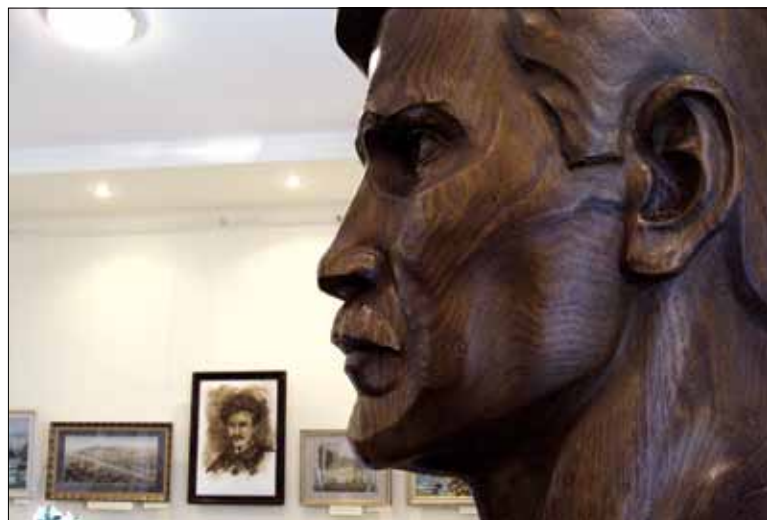
Партрэт Максіма Багдановіча і бюст Аляксандра Грына

Падаем такія падрабязнасці, бо ў Аляксандра Грына — беларускія родавыя карані. А тым больш і Ала Ярмілава прызнае: “Багдановіч і Грын, я прыледзлася, сапраўды падобныя! Дзіўна падобныя! Вядома, тады ўсе насілі такія прычоскі і вусы, але, тым не менш, падабенства тым не абмяжоўваецца. Рысамі твараў падобныя: як у профіль, так і ў анфас! Толькі