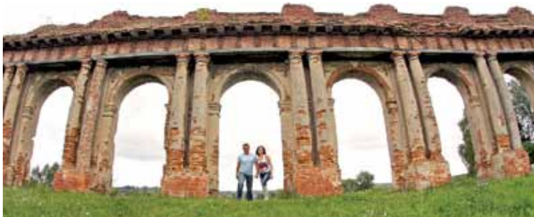
Старажытныя сцены помняць росквіт і багацце магнацкага роду